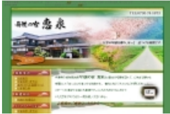
宿帳くん予約ページ